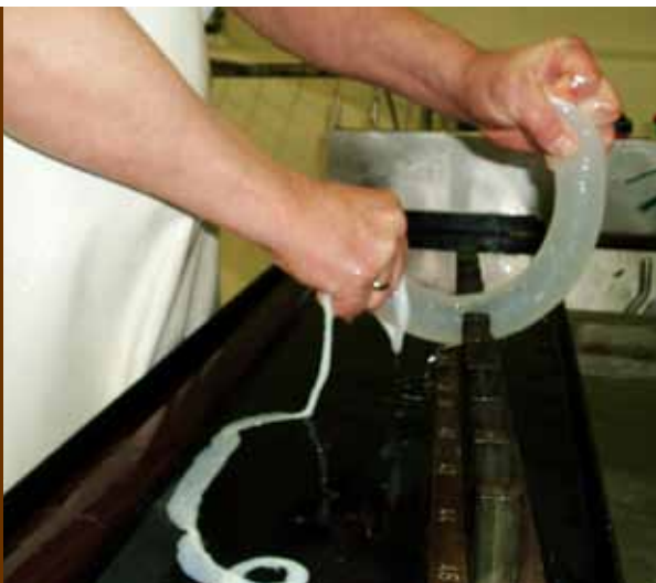
Internkontroll av svinetarm.

I 2008 fikk vi endelig en prisoppgang på fåretarm. Denne fortsatte også i 2009 og medførte at vi kunne sette opp avregningsprisene med 50–63 %