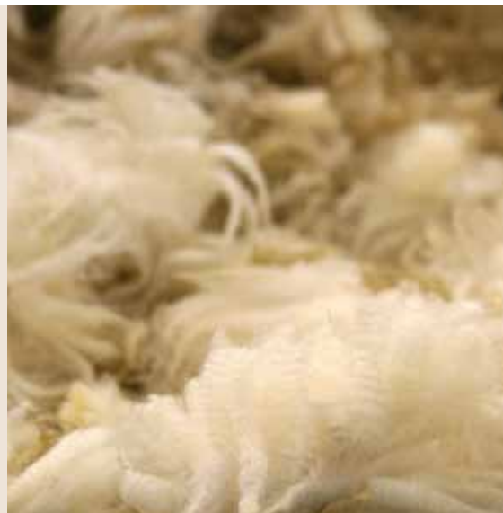
MORTEN SOLLERUD Adm.dir

significant changes in order to meet changes in our markets. The bone-, chicken- and other poultry products have suffered under low demand and falling prices.