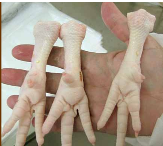
Kyllingføtter – nytt eksportprodukt fra Elverum.

Det har gjennom året blitt jobbet med omlegging av prosesser og sikring av rutiner. Dette vil være et viktig fokusområde også i 2010. Det skal utarbeides forbedringsplaner for plussprodukt-området i samarbeid med alle