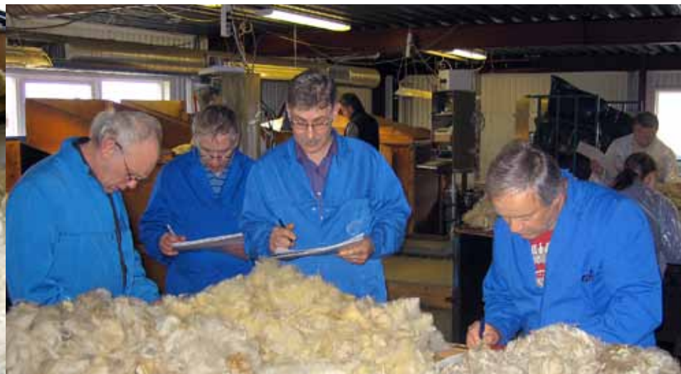
Klassifisering av ull.

by 50–63% prior to the season commencing. As is the case with lamb skin, it is in all likelihood a reduction in the volumes available on the global marketplace that has been the main driving force behind the increase in demand.