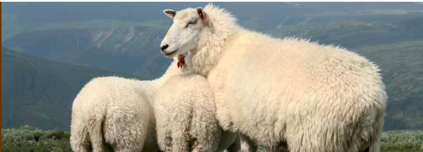
Crossbredsau med lam.

Først sent på våren så vi de første antydninger til at bunnen var nådd. Det fortsatte med forsiktig optimisme gjennom sommeren, før etterspørselen og prisene skjøt fart gjennom høsten. Sjelden har man sett en så rask prisøkning på huder, men siden utgangspunktet var så lavt var prisene ved utgangen av året fortsatt noe lavere enn «normalt». Det var bare huder av god kvalitet som kom fort opp i pris igjen. Dels skyldtes det at det ypperste kvalitetssegmentet klarte seg bedre gjennom krisen enn typiske