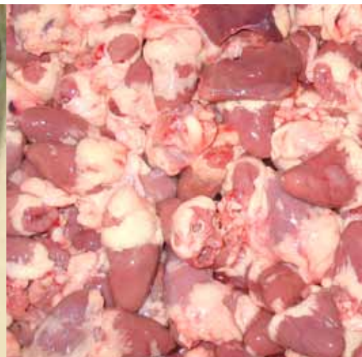
Kyllinghjerter – viktig bestandel

i produksjonen av hundefôr.